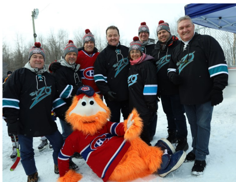
En bonne compagnie à la Classique hivernale de Saint-Zotique.