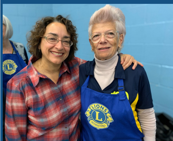
Photo prise à l'occasion du brunch annuel du Club Lions Ormstown le 9 février, bien avant la distanciation sociale.