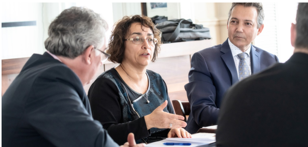
Cet hiver, j'ai mis en place un comité d'action et de suivi qui réunit les acteurs politiques locaux ainsi que les représentants de la Corporation de gestion de la Voie maritime.