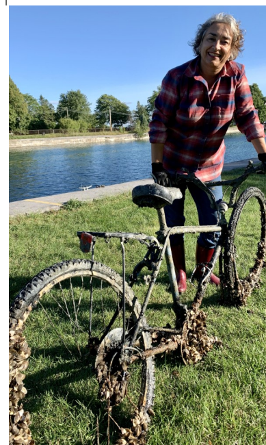
Trouvaille au fond du Canal de Soulanges lors de la Corvée de nettoyage organisée par le ZIP du Haut-Saint-Laurent à Les Coteaux!

Nos bureaux sont ouverts du lundi au vendredi, de 8 h 30 à 16 h 30