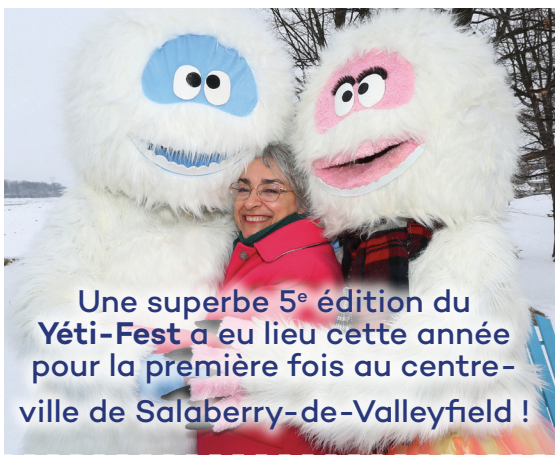
Une superbe 5 e édition du Yéti-Fest a eu lieu cette année pour la première fois au centre-ville de Salaberry-de-Valleyfield !

Les adeptes de motoneiges se sont retrouvés en février dernier à Sainte-Justine-de-Newton pour le Festival de motoneiges antiques.